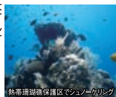
熱帯珊瑚礁保護区でシュノーケリング

珊瑚礁は、世界の海洋面積のたった0.3%なのに海水魚の25%がその珊瑚礁に依存して生きています。カオハガン島の約7倍(36万平米)の広い海域を囲って「カオハガン島熱帯珊瑚礁保護区」を創設しました。自然の中の水族館です。ぜひ覗いて生物の多様性の大切さを感じてください。そして癒やされてください。