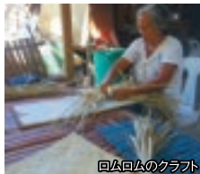
ロムロムのクラフト

色鮮やかな世界的にも評価が高いカオハガン・キルト、機械をまったく使わず一切無添加の手作りココナッツオイル、折れ珊瑚のアクセサリーやロムロムの葉でつくるコースターなど、すべて自然から創りだした地元で根ざした産業です。島民へのインタビューや自らの体験を通じて社会と暮らし、仕事のあり方を考えます。