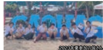
2023年夏参加の皆さん

受験勉強や就職活動など、常に周囲との競争を意識せざるをえない環境から離れて、自分自身と向き合う時間は本当に貴重な体験です。参加者同士で話し合う時間もありません。上手く言葉にできないかもしれないけれど、本当に大切なものがつかめるかもしれません。