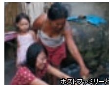
ホストファミリーと

島民は自然からたくさんの恵みを直接いただき、そしてそのいただいた恵みに感謝し、皆で分け合って暮らしています。15歳くらいになると自分が一生を生きていくのに必要な暮らしの技術を身につけ、その日その日を焦らずに、ゆっくりゆっくりと暮らしていきます。どうしてみんな幸せそうに暮らしているのか、ぜひ「自然とともにある暮らし」を一緒に体験してください。