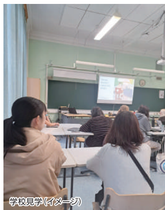
学校見学(イヌーシ)

OECD(経済協力開発機構)の実施した国際的な学習到達度調査(PISA)で、毎年上位にランキングされるフィンランド。でもフィンランド教育の本質はそれだけではありません。フィンランドの教育の特徴のひとつが「落ちこぼれ」をつくらないことであり、18歳までに社会生活ができる人間として自立させることが目標だといいます。子どもの発達に応じた教育が、保護者の経済状況に関わらず平等に保障されている社会システムとその背景にあるものを、実際の教育施設の訪問を通して学んでいきます。