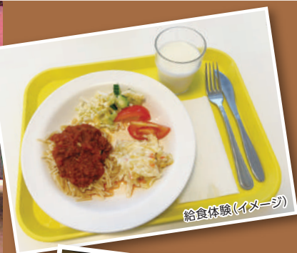
給食体験(イメージ)