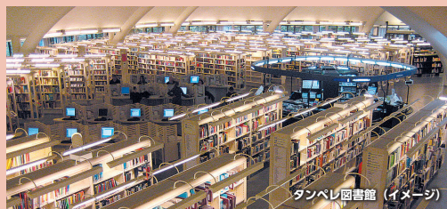
タンペレ図書館(イメージ)

フィンランドの子どもたちの「読解力」を高めている存在が充実した公共図書館です。読書教育では、学校や学校図書室との協力関係も築いています。フィンランド国民の図書館利用率もたいへん高く、国際的にも注目されています。