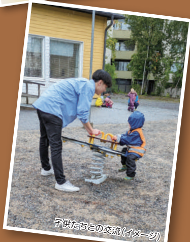
子供たちとの交流(イメージ)