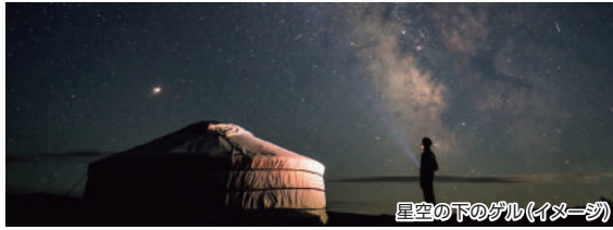
星空の下のゲル(イヌーゴ)