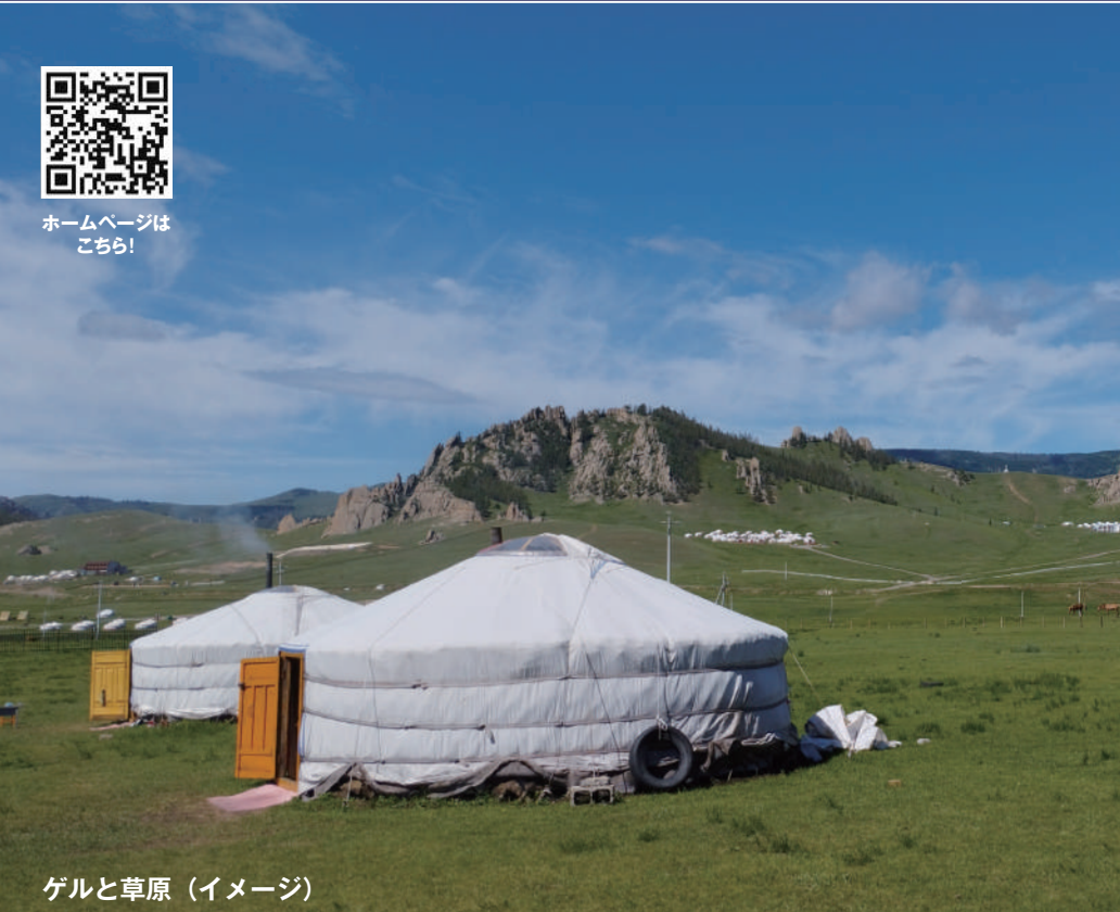
ゲルと草原 (イメージ)